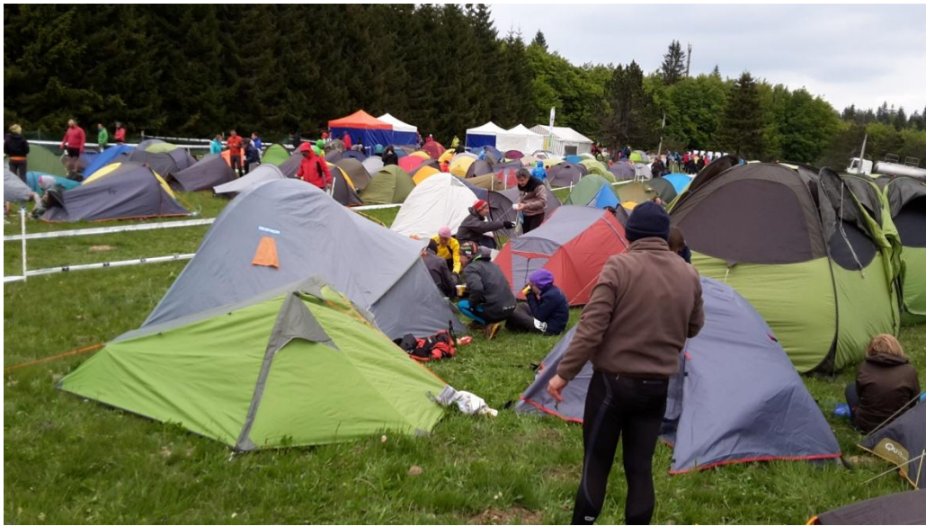
Une installation fraîche, après un apéro rapide pas de soleil et du vent chacun réalise sa petite tambouille au mieux !!!!!